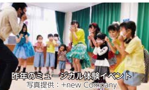
昨年のミュージカル体験イベント