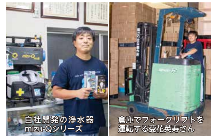
自社開発の浄水器 mizu-Qシリーズ